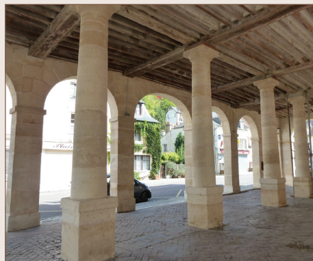
Les halles de La Roche-Guyon

FFRandonnée Val-d'Oise, www.randovaldoise.com