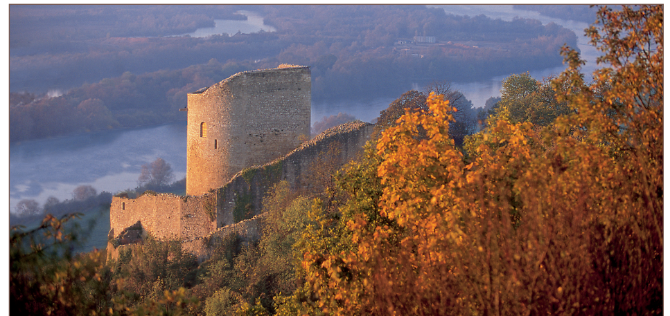
Donjon du château de La Roche-Guyon