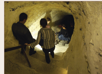
Visite du patrimoine troglodytique

potager des Lumières, des salons d'apparat aux casemates aménagées par Rommel durant la seconde guerre mondiale.